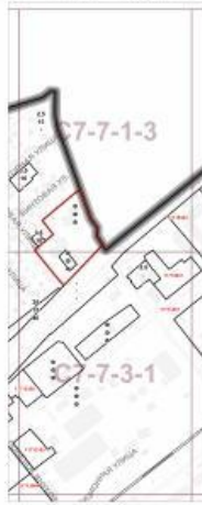
Границы территориальных зон, подзон территориальных зон и предельные параметры разрешенного строительства, реконструкции объектов капитального строительства